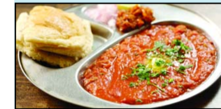
टेस्टी पाव भाजी खाना तो सबको अच्छा

लगता है। इसे आप बाहर तो खाते ही होंगे, अगर आप चाहें तो इसे घर पर भी बना सकते हैं। आइए आज आपको पाव भाजी बनाने की विधि सिखाते हैं-